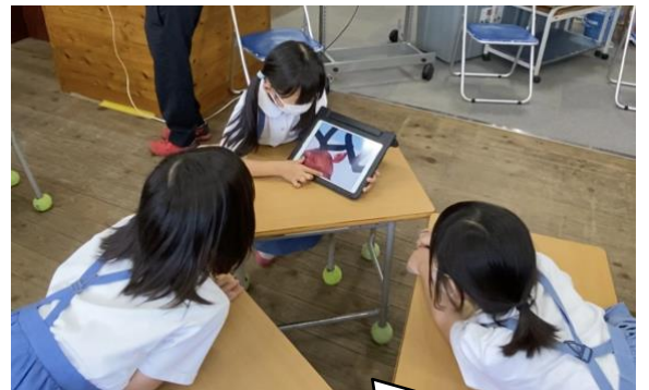
タブレットを見せながら、お友達の話を受けとめ、話し合いました。