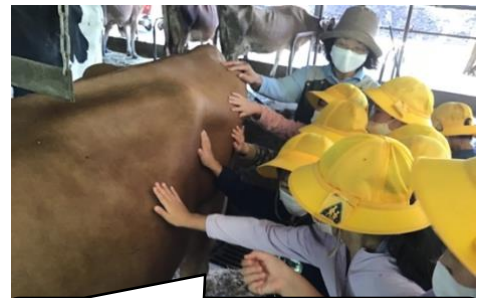
実際に牛を触りました。生命をもっていることが伝わってきますね。