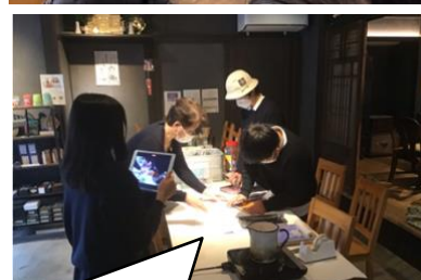
自分たちでアボをとって取材し、PR動画、パンフを作っています。