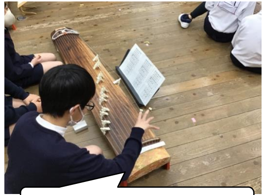
さくらさくら・・・の演奏をしています。