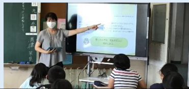
6年生は、「いじめについて考えよう」という道徳の学習で、「いじめ」についての自分の意見を伝え合う学習をしました。