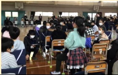
久しぶりの交流活動は活気がありました