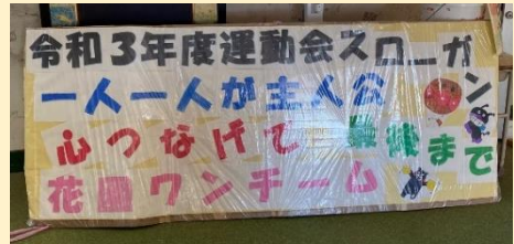
スローガン達成が十分にできたと思います

12月24日(金)2学期終業式を行いました。2学期に私が印象深いのは、11月実施の運動会でした。コロナ禍での2度の延期で、子どもたち、先生方は練習の意欲を持続させるのが大変だったと思います。気持ちを切らさずに取り組んだ精いっぱい演技や競技に感動しました。特に、徒競走でゴールまで一生懸命走る姿に、何事にも全力で取り組む花園小の子どもたちのよさが発揮できていたと思いました。3学期の始業式は1月11日(火)です。現在、オミクロン株の市中感染が確認され、第6波が心配されています。学校では市教委の指導のもと、様々なケースに対する備えを考えていきます。今後ともご支援ご協力のほどよろしくお願いいたします。