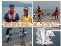
【遊泳中の安全啓発動画】