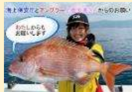
【釣り中の安全啓発動画】