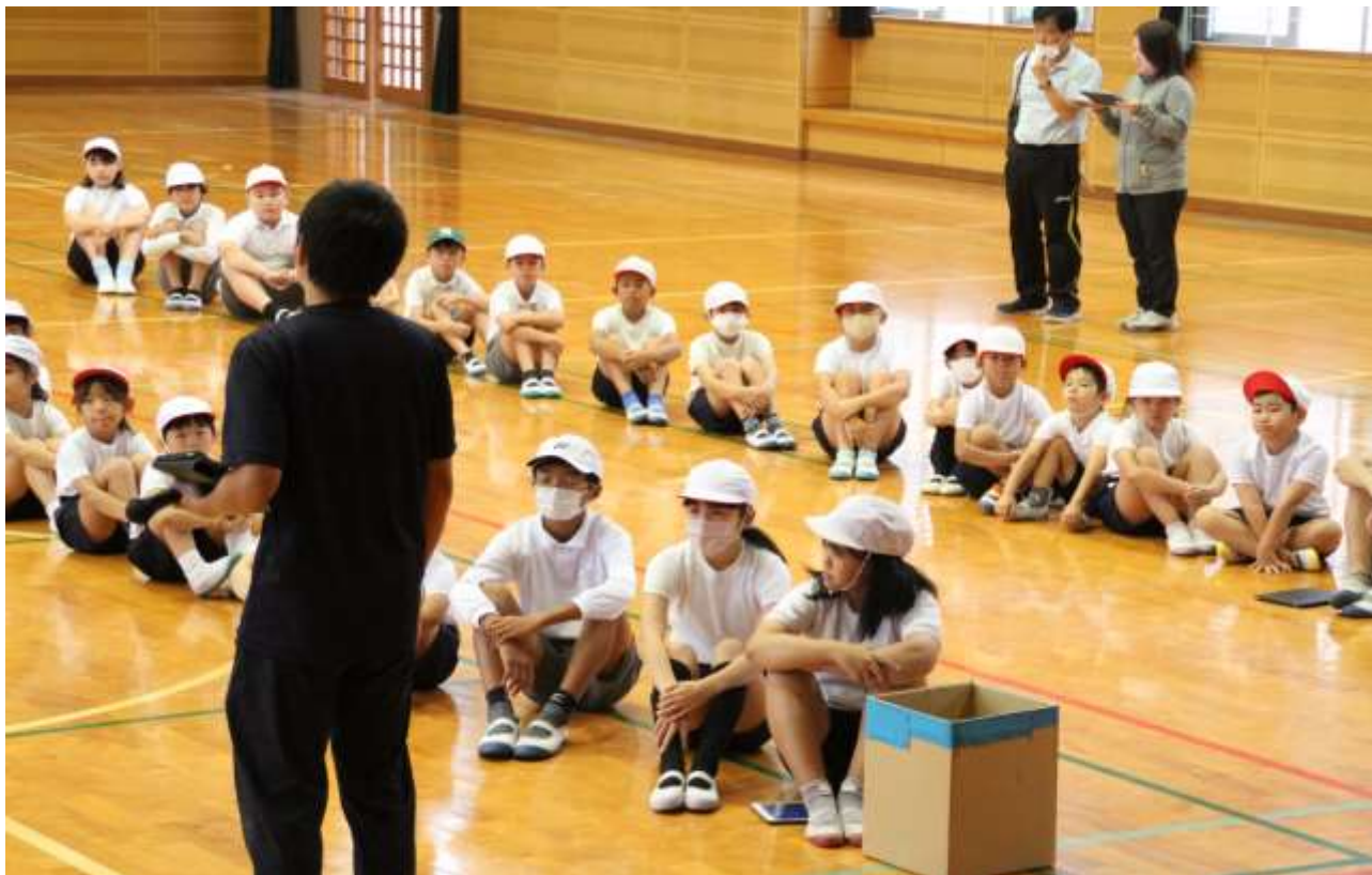
リレーの説明を聞く白組

明日の運動会に向けて、これまでいろいろな準備をしてきた子どもたちです。学校だよりでは、運動会が終わった後も秘話として紹介したいと思います。