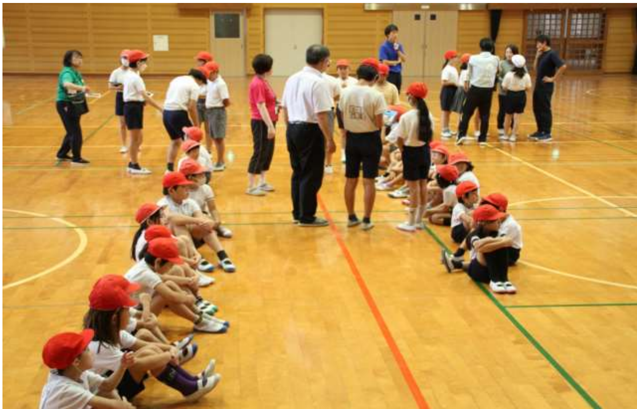
高学年を中心に順番などの作戦を立てる赤組