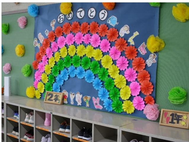
1カ月前の本荘小校内のスナップです。早いものですね。

明日から連休後半です。病気や事故のないように指導をして帰しております。よろしくお願いします。