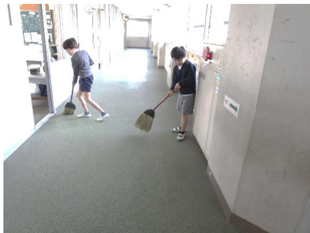
なかよし2組も掃き掃除を頑張り中

この日の始業式には、ニュースの取材もありました。始業式での子どもたちの「対話」活動の様子や学級での新年の目標発表などが紹介されていました。この学校よりも本荘小HPで公開して情報発信をしておりますが、TV局のニュースになると発信力が違いますよね。子どもたちの生の姿や先生方がどのような立ち位置で子どもと接しているか、そういったリアルな映像はとても大事だと思います。今後ともメディアと連携していきたいと思っております。