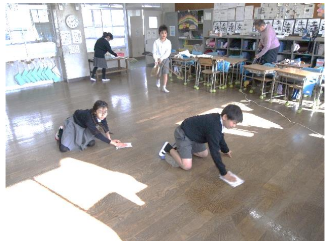
4年生も教室の大掃除