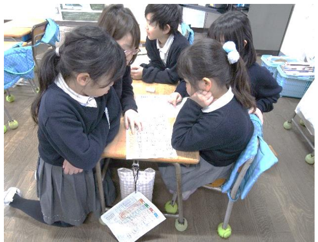
2年生は、3学期のめあてを考え中