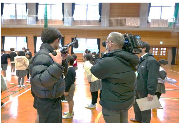
【始業式：カメラクルー】