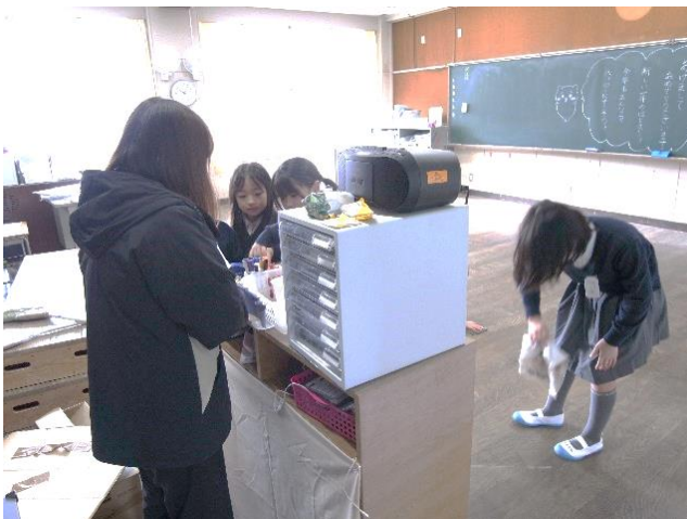
3年生は、教室の大掃除中