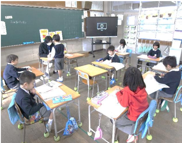
1年生は、冬休みの宿題の提出中

初日から給食でしたが、こどもたちはおいしそうに食べていました。3学期も元気にがんばる子どもたちであってほしいものです。※裏面に続きます