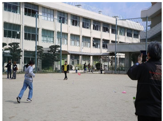
舞い上がったロケットを追いかけるみんな