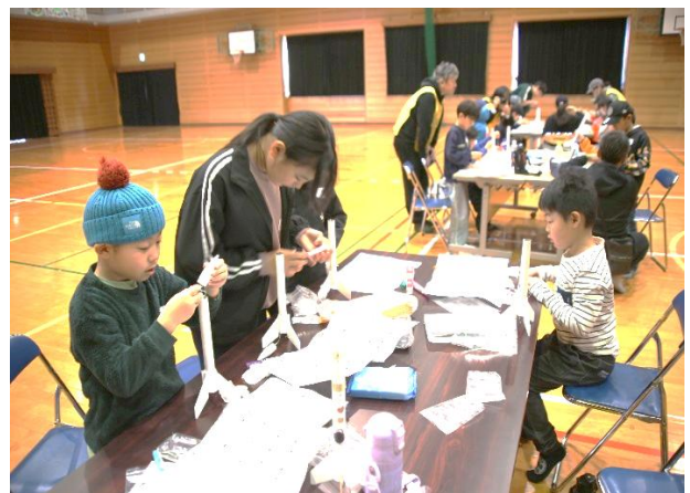
みんなで力を合わせて制作中