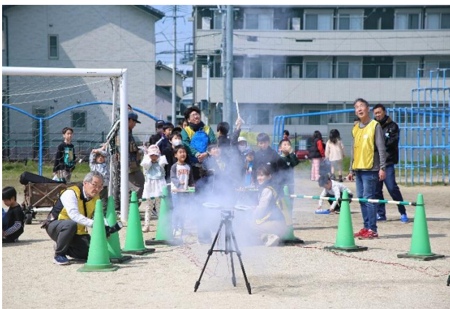
ロケット発射！時速200km