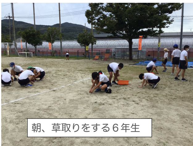
朝、草取りをする6年生

また、5年生の児童は、1時間目の休み時間に各教室を訪れて、あいさつ運動をしていました。