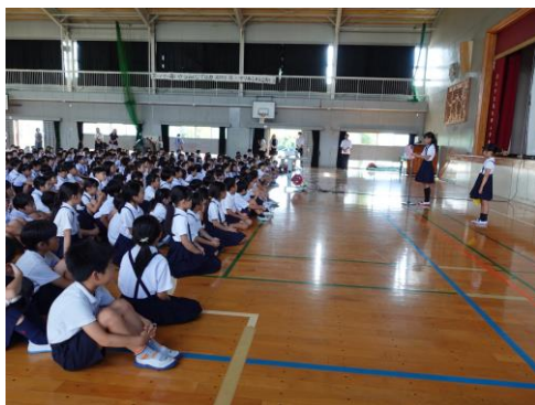
1学期の振り返りを堂々と発表しました

「40」この数字は何でしょう？そうです明日から始まる夏休みの日数です。夏休みでなければできないこと、何かやってみたいこと、自分を伸ばしたいことはありますか？チャレンジ・挑戦してください。40日後の8月29日には「なりたい自分」に成長したみなさんに会えることを楽しみにしています。