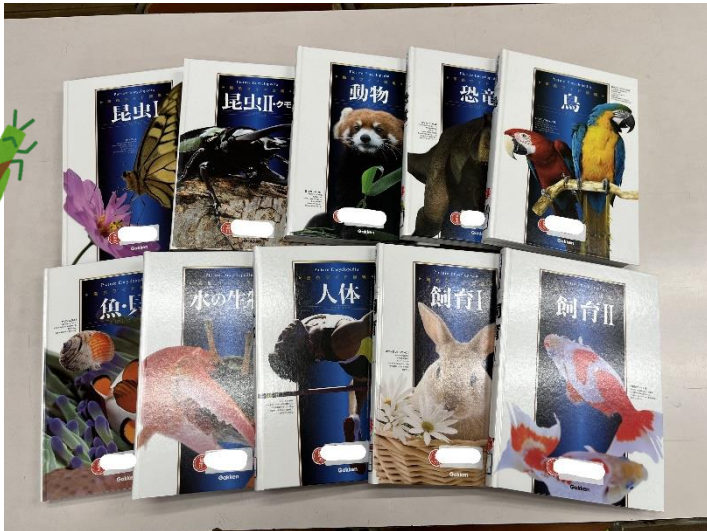
げんしよく ずかん ぜん さつ Gakken 原色ワイド図鑑 全10冊 Gakken