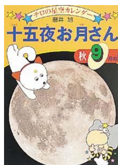
チロの星空カレンダー・9 秋・9月の星 十五夜お月さん ふじいあきらちよ 藤井旭著 ポプラ社 1993 443/フ