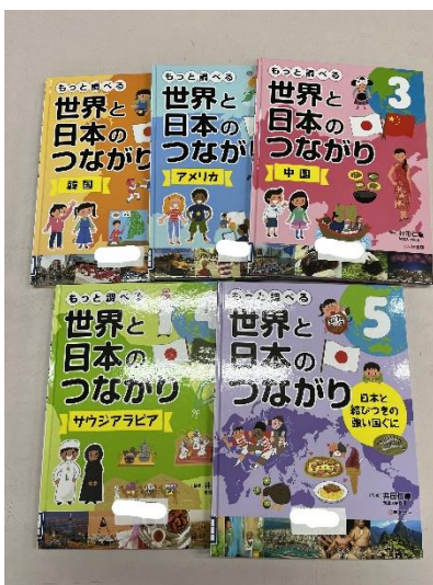
せかい にほん ぜん さつ いわさきしょてん 世界と日本のつながり 全5冊 岩崎書店