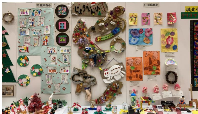
実際に展示した作品

今年度は3年ぶりに校外学習を行いました。ハッピースマイル・アートギャラリーに作品を出展し、他の学校の作品も見学してきました。また、見学に行く際は、実際のバスを使ったり、お昼ご飯をお店で注文をしたり、普段の生活に生かせる学習を行うことができました。