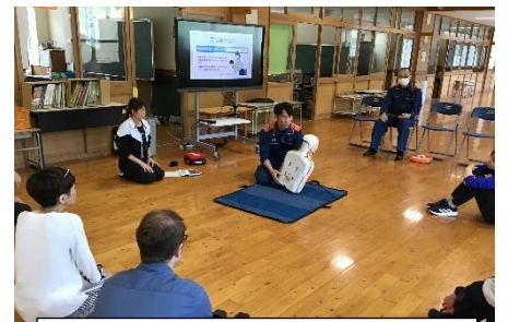
救命のための実技研修 異物除去の方法も学びました