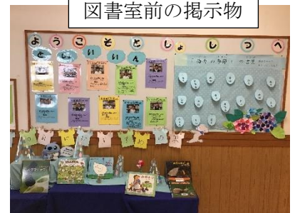
図書室前の掲示物

小学生のうちに様々なジャンルの本と出会い、心と頭に栄養を蓄えることで、将来にわたって豊かな人生を送ることができるものと思います。河内には、公民館の図書室もありますので、休日には親子で読書もいいかもしれませんね。(現在はコロナ対応で予約貸し出しのみみたいです。)