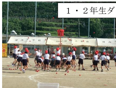
1・2年生ダンシング玉入れ