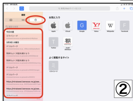
時計マークをタップすると 履歴が見えます

※初期設定では、 履歴を消せない(過去1か月分が 残る)ようになっていますが、 子どもたちが裏技として消し方 を知っている場合もあります。 子どもたちには履歴を消さない ように指導しています。