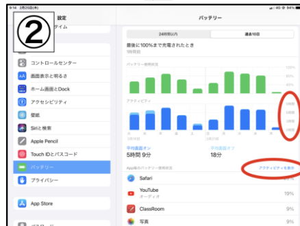
「アクティビティ」の使用時間 をチェック 「アクティビティを表示」をタップすると、 アプリごとの使用時間がわかります