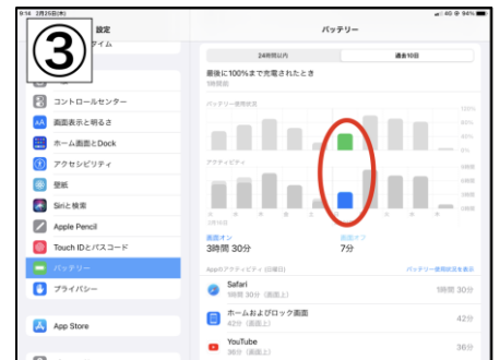
曜日をタップすると1日ごとの 使用時間が見えます