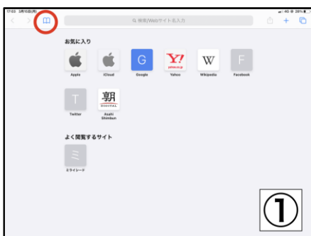
左上の本のマークをタップ