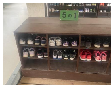
【 さすが！高学年は、しっかりかかとをそろえています。 】