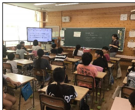
【 各学級での話し合い 】