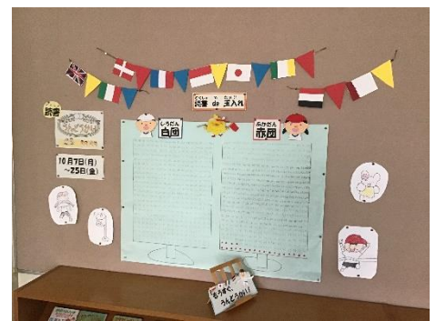
【 図書室の読書玉入れ 】