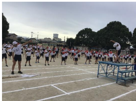
【 全体練習 】