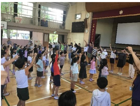
【 体育館での結団式 】

図書室では「読書うんどうかい」の取り組みが始まっています。今週は白団が優勢でした。子どもたちが考えたこの素敵なテーマのもと、一人一人が運動会練習や本番を通して、大きく成長してくれることを願っています。