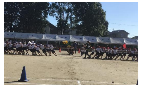
【 5・6年 ロックハイヤ 】