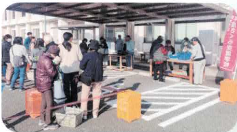
平成さくら支援学校の生徒による販売会 地域とともに歩み、地域に根ざして大切にされてきた活動です。