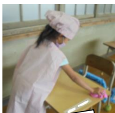
1年生も昨日から給食が始まりました。当番の仕事もちゃんとやっていました。すばらしい！1日目はカレー、2日目はクリームシチュー。みんなの大好きな目黒でした。おいしかったでしょ！！