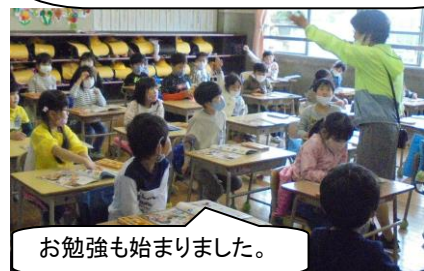
お勉強も始まりました。

今週はどの学年も道德の第1回目を行いました。今年も本校は「熊本市教育課程研究モデル校」ですが、国からも要請があり、「文部科学省教育課程実践検証協力校」として、研究を進めることになりました。全国でも注目の学校なのです。(エッペン!!)特別活動を軸とした道德教育を推進し、子どもたちの姿で研究の成果を全国にお知らせしたいです。