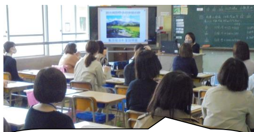
5年生は後半宿泊教室についての説明を主任から全クラスに配信。ミヤマキリシマが美しい季節。登山をがんばってほしいな。

さて、昨年度の反省「担任と保護者が顔の見える関係に・・・つながる」という意味でも、今年は家庭訪問もさせていただきます。家庭訪問を実施することで、児童の登下校の安全を確認し、また家の場所を知ることで何かあった時に備えることができ、また子どもさんの家庭の様子などのお話を聞いたり学校での様子をお伝えしたりすることで、さらに教師も保護者も子ども理解を深めることができます。