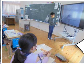
3・4年生の授業では、自分の考えを言ったり書いて説明したり。みんなを納得させていました。すごいですね。