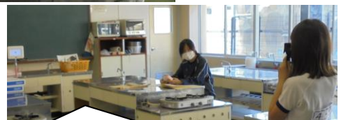
4年生が視力検査をしていました。密をさげ広い家庭科室で視力検査。視力が落ちた人早めに眼科に行こうね。仮性近視は治るよ。