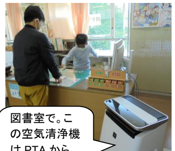
図書室で。この空気清浄機はPTAから

また、できるだけ個人の教材・教具を使用し、子ども同士の貸し借りはしません。1年生に算数セットを個人で買っていただいたのは、感染防止対策の観点からでもあります。共通で物を使用した場合は、手洗いを徹底させます。図書室へ入る前と後も、手洗いを励行します。今日はお昼の放送で、保健主事から子どもたちに再度注意を促しました。また理科の時間も、専科の先生から実験中など密にならない指導が 있었습니다。放課後は、昨年までSSSさんに消毒をしていただいていたのですが、本年度から職員で放課後、