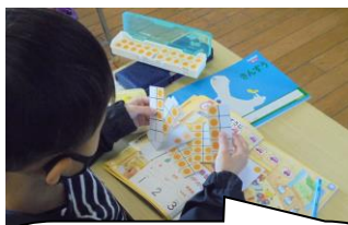
1年生の算数では、実際に具体物を「手を動かして考える」として数の概念や計算の過程をイメージさせることを大事にしています。楽しく学ぼうね。

また、できるだけ個人の教材・教具を使用し、子ども同士の貸し借りはしません。1年生に算数セットを個人で買っていただいたのは、感染防止対策の観点からでもあります。共通で物を使用した場合は、手洗いを徹底させます。図書室へ入る前と後も、手洗いを励行します。今日はお昼の放送で、保健主事から子どもたちに再度注意を促しました。また理科の時間も、専科の先生から実験中など密にならない指導が 있었습니다。放課後は、昨年までSSSさんに消毒をしていただいていたのですが、本年度から職員で放課後、