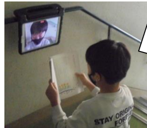
3年生は音読を自撮りしていました。何回も練習して、単元の最後にもう一度撮って比べていると上手になったことがわかります。がんばれ！