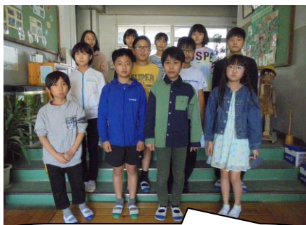
内閣就任の記念写真みたいだね。赤じゅうたんじゃないのが残念だわ。