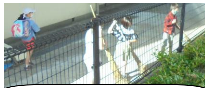
5年生も朝から落ち葉を集めてくれました。ありがとう。