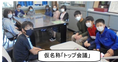
仮名称「トップ会議」

本年度は特に、6年生と一緒に日本1幸せな学校に・・・学校を楽しみたい、盛り上げていきたいと思っています。6年生と一緒に、子どもが主体的に笑顔で活躍する学校を創っていきたく考えています。そこで、今週は2回、放課後10分間、各委員長に校長室に集まってもらいました。初日は自己紹介と私の想いを実現するには、真のリーダーが必要であることを話しました。委員長たちはとても反応がよく、リーダーとして頑張ろうという気持ちで溢れていました。そして宿題を出しました。なぜ委員長になったのか、また大江小のよさと課題、そして私の思い付きの「トップ会議」という名称をどうするか、考えてもらいました。2回目は、「大江小の子どもぐらし」を各自のタブレットに送信し、見直してもらう宿題を出しました。社会通念に合わせて教師が作った「大江の子どもぐらし」。自分たちで本当に必要なのかわかりを考えてもらいます。大人からの押し付けではなく、自分たちで納得してきまりをつくれれば、きっと守るはず。もちろん、命・安全にかかわることなど、私がゆずれないものもあります。6年生に確認してもらって、納得した上で令和3年度の「大江小の子どもぐらし」を完成させます。3回目の会議は、来週の月曜日です。