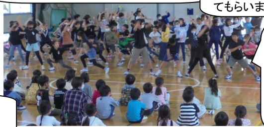
5年生。ソーラン節。前奏が流れたら「洪～い」と1年生の声(笑)