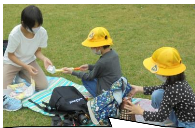
6年生は本当に優しいね。1年生は大江小のよさが実感できたでしょう。

白川公園に11時についてすぐお弁当を食べました。1年生は6年生と一緒に。もちろん同じ方向を向いて、感染拡大防止に努めながらの新しい遠足のお弁当の食べ方です。その後は、白川公園貸し切りで、遊びました。シロツメクサで輪っかを作ったり、先生と鬼ごっこをしたり・・・本当にとても楽しそうでした。全校児童がいっぺんに遊ぶには、白川公園くらいの大さじゃないと遊べません。大江小は、休み時間の運動場使用を分散で行っています。だから、今日は全員が嬉しそうに走り回っている姿をみて、私もとても嬉しかったです。