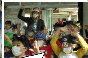
誰??この背の高い人? ナリナリだ～～(笑)