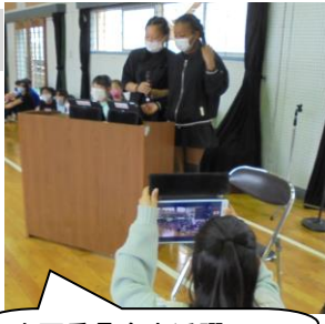
企画委員会大活躍！司会も上手ね。