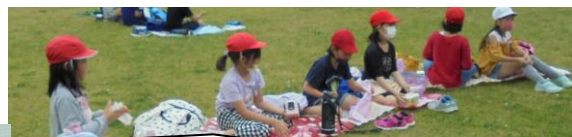
ちゃんと一列で。お弁当とってもおいしかったね。