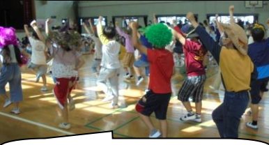
4年生の楽しいディズニーダンス。ドナルドもいました。グエッグエツ