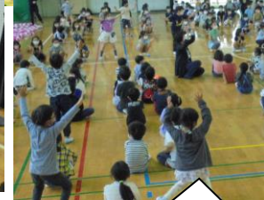
2年生の出し物。何月生まれかな？