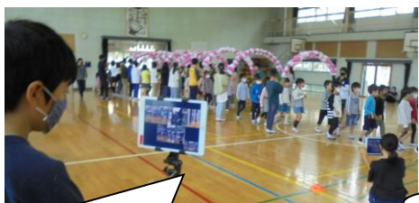
情報委員会大活躍！ライブ配信