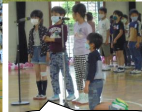
3年生に寸劇。困ったときどうしたらよいか教えてもらいました。