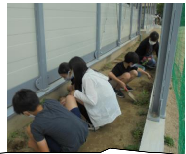
今朝は3年生が先生と一緒に草取りをしていました。ありがとう♥

また、タブレット使用についての親子学習会(親子で土日に視聴し、学び、ふりかえりを提出)を開催します。全員がロイロノートが使えるようになってから、後日行います。(昨年、お兄ちゃんお姉ちゃんがやったのと同じです。)初めての保護者の方は、楽しみにしておいてくださいね。