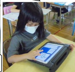
2年生はタブレットで漢字の書き順の練習。