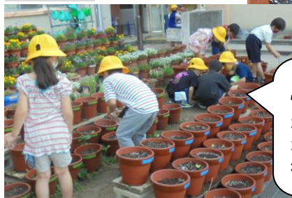
1年生が朝から愛情たっぷりにお水かけ。あら、もう芽が出てきましたね。うれしいね。