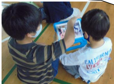
みんなありがとうね♡

朝からたくさん子どもたちが、すっきりしたえのきジュニアのもとに集まり、草取りをしてくれました。ありがとう。なんか木々がとても喜んでいました。今年のみどり委員会の人たちも、とても積極的に活動してくれます。よい伝統ですね。