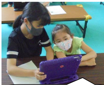
お姉さんがしっかり教えてくれたので、使えるようになりました。