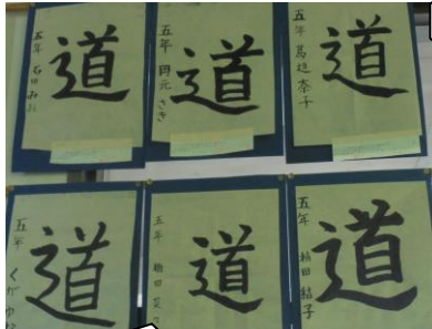
5年生。しんによは難しいけど、がんばって書きましたね。