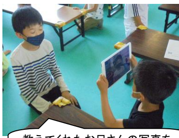
教えてくれたお兄さんの写真を撮っていました。上手ですよ。