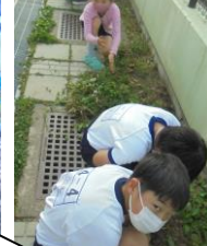
朝からいい汗かきました。