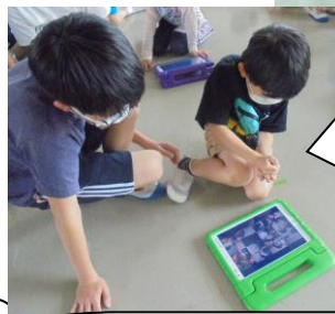
ZOOMでクラスのみんなの顔が見れて、1年生はとっても喜んでいました。今度はお家でZOOMに入る練習をしなきゃね。