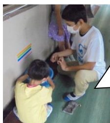
6年生が下学年に掃除の仕方を教えてくれました。ありがとう。