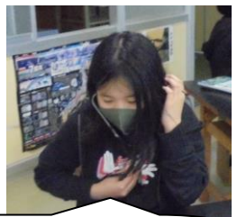
6年生は理科で自分の心臓の音を聞きました。ドクドクと聞こえたそうです。