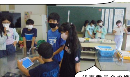
代表委員会の準備かな？昼休みありがとう。