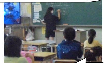
5年生の算数。難しくなってきたね