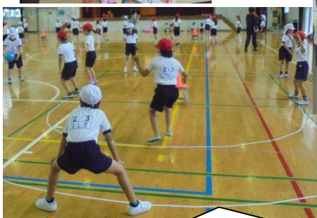
2年生は体育。真ん中のコーンに当てたら1点だそうです。赤が守っています。