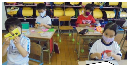
1年生は色紙を折ってハサミでチョコキチョコキ。広げたらいろいろな模様できました。