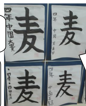
4年生。力強い「麦」が書けましたね。すばらしいよ。