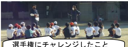
選手権にチャレンジしたことがすばらしいと思う。

さて昨日は6年生が、朝から紅白リレー選手決めが 있었습니다。小学校生活最後の運動会。応援団とリレー選手は、練習時間も重なりますので、本校では兼ねることはできません。6年の応援団は、団のみんなをまとめるリーダー、リレー選手の6年生は、1～5年生の選手をまとめるリーダー、どちらも大事なリーダー・・・責任があります。その他にも、各係の仕事を、責任もってやってもらいます。6年生1人1人が、大江小のリーダーです。運動会の本格的な練習は来週からですが、水面下でいろいろな準備が行われています。応援団長さんが「本格的に練習が始まる前に、応援歌やダンス、演舞など一通り決めて準備しておかないと・・・」とつぶやいていました。頼もしいですね。やる気満々です。