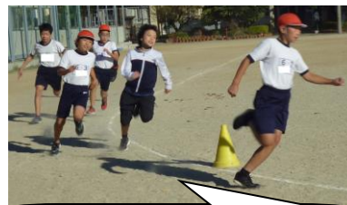
男子リレー選手決めは一発勝負