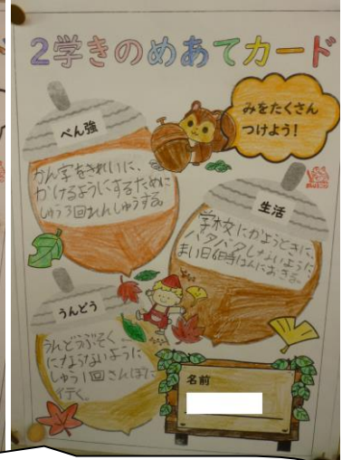
とても楽しいめあてカードですね。