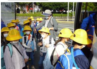
1年生は「ミルク牧場」見学に出発。晴れてよかったね～。レベルが下がリアイスも作って食べれたかな？