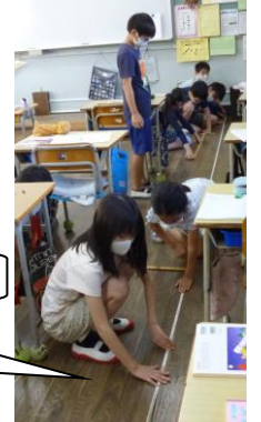
4年生はみんなで協力して教室の面積を測っていました。