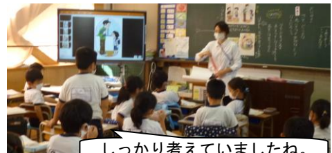
しっかり考えていましたね。

「挨拶で大切なことは何か」を考えました。先生には挨拶をするけれど、友達には恥ずかしくてしないという子どもたち。相手もしないから自分もしないという人もいました。挨拶は「おはよう」「こんにちは」だけではありません。「ありがとう」「ごめんなさい」も挨拶の中の1つです。子どもたちは資料の場面で、なぜ言えないのか、自分事として理由を考えました。そして、ペアになって動作化してみることで、自分や相手の気持ちを考えていきました。「挨拶は大事だ」はみんな知っています。気持ちのよい挨拶が、自分たちの生活を明るくすることを体得してほしいです。