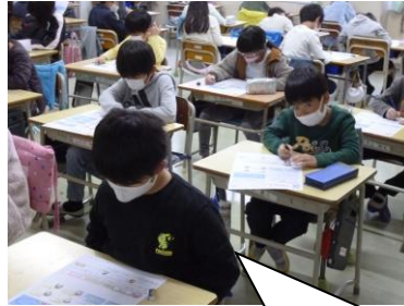
学期末のテストや漢字大会、計算大会。みんながんばってるね。やり直しが大事よ。