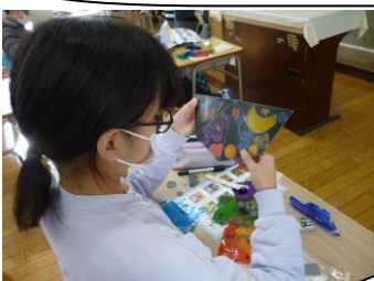
6年生の図工はスタンドクラス風置物。カッターナイフも上手に使っていますね。

エコピカ委員会の取組です。「朝ピカキャンペーン」ネーミングも内容もすてきですね。