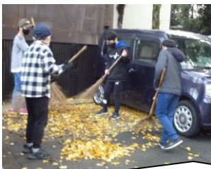
やっとやっといちょうの葉っぱが落ちてしまいました。寒い中、毎朝こつこつ掃除をしてくれた人たち、本当にありがとう！