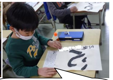
3年生は習字の作品に自己評価を貼り付けていました。堂々としたりっばな「心」ですね。