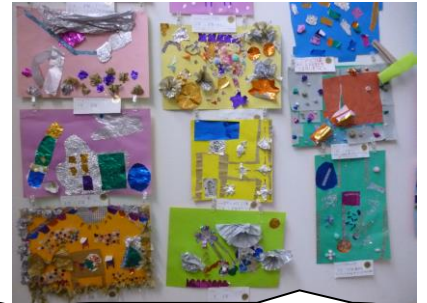
プレハブの4年生の作品です。キラキラしていてクリスマスムードたっぷりです。