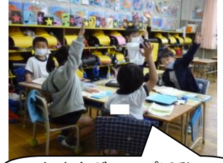
1年生もグループ活動で話し合いが上手にできるようになりましたね。