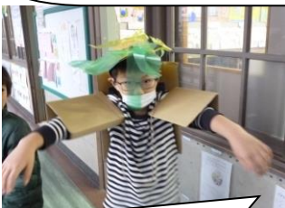
2年生の図工は「へんし～ん！」やっぱり男の子は勇者が仮面ライダー系に変身しますよね。