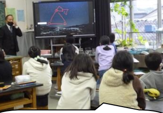
理科は冬の星座の見方。冬の大三角を自分で見つけることができるかな？