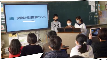
5年生の総合は、ZOOMで各教室をつなぎ各班の発表会をしていました。一同集まらなくても一緒に学習できます。便利な世の中になりましたね～