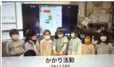
かかり活動 花東クイズ会社

「一生懸命がんばって、立派な2年生になります！」と力強く言ってくれました。ポーズも決まっているね。