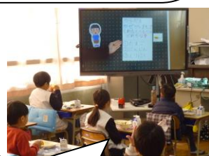
栄養指導を見ながら黙って食べています。