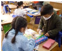
紙相撲。トントンして楽しそう♡

どのクラスも書初めが展示してあります。1年生は、気持ちをこめて書きましたね。4年生は四字熟語を調べて書いたのですね。「どんどや」があれば、全校児童の書初めをぐるぐる巻きにしてみんなの字の上達を祈願したのですね。来年はきっとどんどやもできるでしょう。