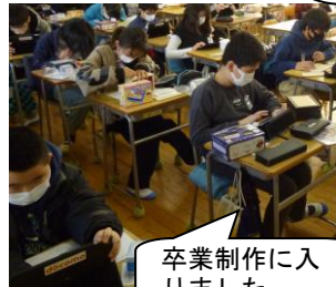
卒業制作に入りました。