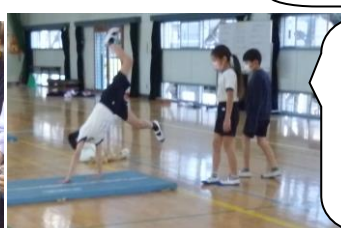
4年生の理科と体育。いろいろ新しいことに挑戦しています。もうすぐ高学年。学校のリーダーになります。