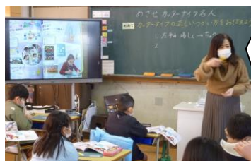
2年生。初めてのカーターナイフ。徹底的に安全指導。最初が肝心です。