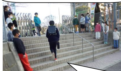
生活委員会さんと3年生も朝の挨拶運動。ありがとう。