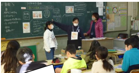
5年道徳。役割演技で自由について考えていました。