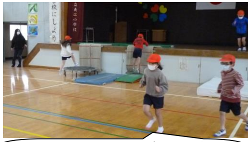
崖(ステージ)にジャンプしてのぼります。トランポリンも使って。