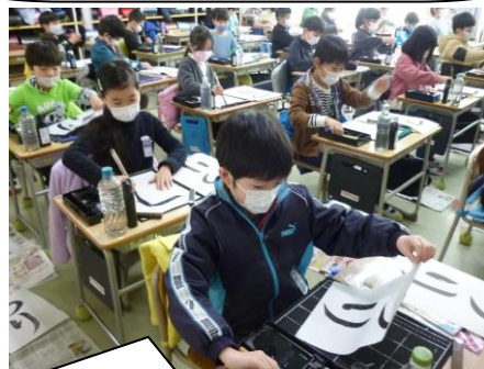
3年生習字「つり」いい字が書けていますね。