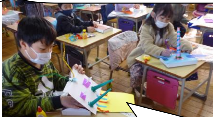
1年生。図工。うきうきボックス。作りながらうきうきしちゃうね。