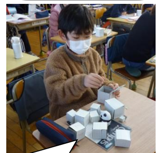
4年生の算数。直方体がいっぱいできたね。うまいな～