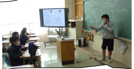
3年生。算数。説得力のある説明でした。すごいね。