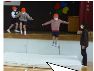
トオー!!かっこよく飛び降ります。ちゃんと安全マットが敷いてあります。