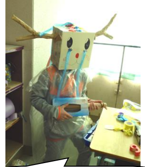
なぜ泣いているの(笑)