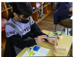
4年生。しっかり頭の中で設計図ができているのでしょう。色をつけるとまたいい感じになりますね。丁寧につくっています。真剣な表情がすごいです。