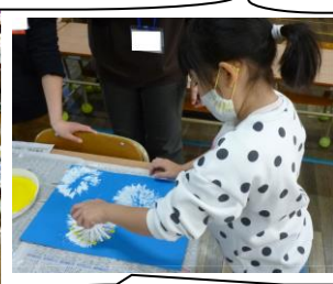
ひまわりさんはタンポポの絵をトイレトペーパーの芯を筆にして描いていました。きれいなね。