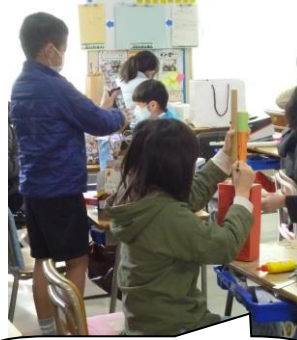
一生懸命かつ楽しそう

今日、校内をまわってみると、2・3・4年生が楽しそうに図工の学習をしていました。子どもたちは、就学前から地面に絵を描いたり、積み木やブロックをしたりして、つくりだす喜びを味わうとともに、①見たり感じたりする力 ②次にどのような形や色にするかを考える力 ③それを実現するために用具や表し方を工夫する力 ④一度つくったものを改めて見て、新たなものをつくりだそうとする力 など造形的な資質・能力が自然に身に付いています。小学校では、このような子ども自身に本来備わっている資質・能力を一層伸ばし、表現及び鑑賞の活動を通して、造形的な見方・考え方を働かせ、生活や社会の中の形や色などと豊かに関わる資質・能力を育成していきます。活動や作品をつくりだすことは、自分にとっての意味や価値をつくりだすことであり、同時に、自分自身をもつくりだしていることだそうです。「芸術は爆発だ」と言ったのは、太陽の塔をデザインした岡本太郎さん。子どもたちも、自分の心を動かし、そのエネルギーで創造し、自分らしさを表現しているのですね。みんな芸術家の立派な卵です。