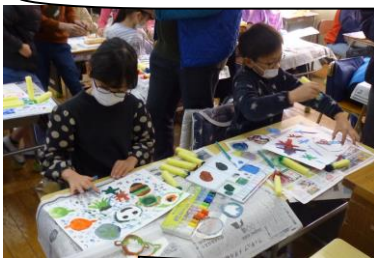
2年生の型押し色版画。誰1人として同じ作品にはならない。独創性があり、それぞれの物語があります。