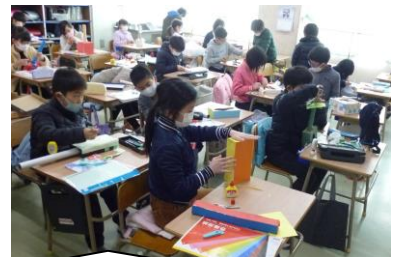
3年生。空き箱をさわっていると想像が広がります。