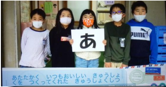
1年生は小学校の四季。最後にランドセル芸（笑） 2年生は思い出の場所巡り。最後は一文字。ナイス