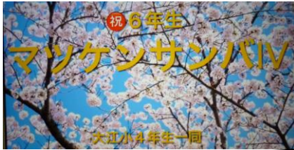
3年生は手話で気持ちを表しました。 4年生はマツケンサンバ。得意技披露を盛り込んで、オレ!