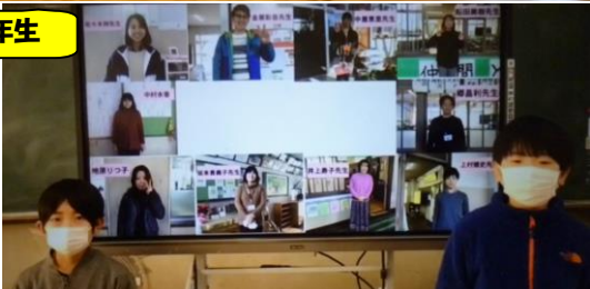
5年生は100%勇気のダンス。さすが5年生。息もぴったり。6年生は先生方への感謝の気持ち、各学年へのメッセージを伝えてくれました。すてきな発表でした。ありがとう。