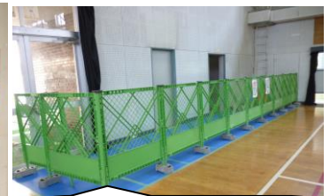
体育館のトイレが洋式になり数も増えます。多目的トイレもできます。よかったですね。しかし完成は4月です。