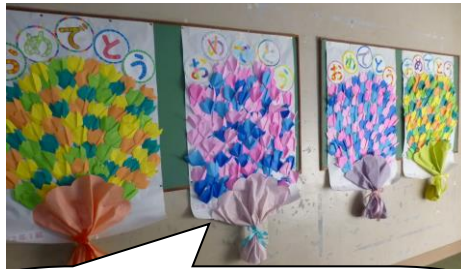
各クラス、卒業を祝う掲示物を作成しました。これは2年生の4クラスの掲示です。とても美しいです。

6年生の保護者の皆様には、ペアシートを準備します。椅子を2個ずつくっつけて、前後に距離をとって座っていただきます。1家族2椅子ですので、お一人の参加者でしたら残りの椅子は荷物置きにでも使ってください。本年度大きく変えたことは、保護者席をあらかじめ指定することです。ハートフルコンサートの時のように、事前に子どもさんに「くじ」を引いてもらいます。例年、よい席をとろうと、寒い中早くから並べれます。長い行列・密にもなります。今年は体育館のトイレも工事中で使えません。指定席ですので、どうぞ焦らず受付時間内（8時50分～9時20分）にお越しください。もう一つ、指定席にすると、万が一コロナ感染者が出た場合、保健所に提出する座席表にも活用できます。子どもたちの呼びかけは、一人一人台の上に立っての発表ですので、どの席からもちゃんと見えます。ご安心ください。後ろの席を引いて来ても、子どもさんを責めないでくださいね（笑）。さて、運命のくじ引きはいつかな～？ドキドキして待っておい