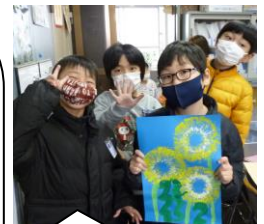
ひまわり組さんからたんぼぼの絵をもらいました。校長室に飾ります。