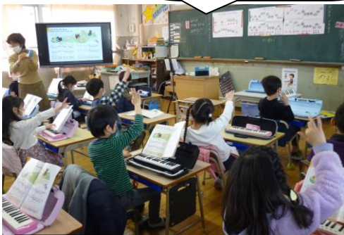
4年生はタブレットを使って協働学習。みんなの意見をまとめて、プレゼンをつくっているのかな？