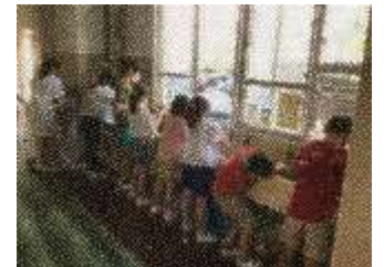
始業式に続いて行われた大掃除！みんなでがんばってきれいにする様子があちこちで見られました。