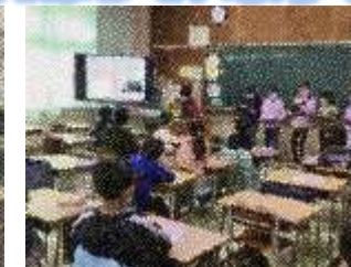
◆班で協力して理科の実験を