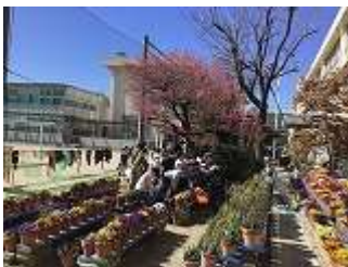
■植木鉢で育てている花の観察

今日から3月になりました！1月は「行く」2月は「にげる」に続いて、3月は「去る」と言われるように、1年で一番短い3学期はあっという間に過ぎてしまう感じがします。3月は、一年のまとめの大切な時期だと言えます。次の学年に向けて、やり残しがないように見通しをもって取り組むようにしたいものです。後でやろう…という後がだんだんなくなってきたわけですからね。最後にバタバタとあわてなくていいように、早めにやってしまうようにしましょう。学年のまとめをきちんとして、進級できるようにがんばってほしいと思います。