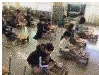
■金づちを使った図工の授業