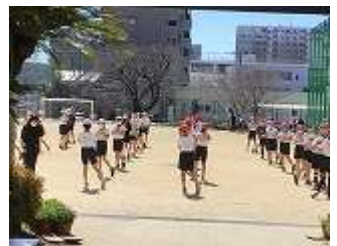
■準備運動を入念に行って！