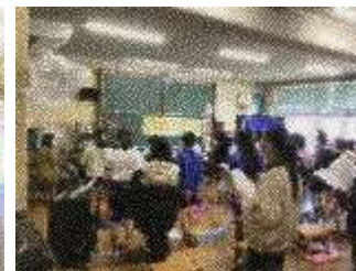
■6年生は卒業式の歌の練習を♪