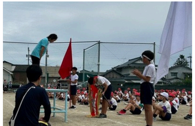
赤組 優勝おめでとう！