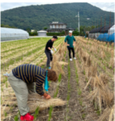
・11月10日。午前中、執行部数名で立て。

6年度は、会場予定の河川敷が現在工事中の為、利用が難しいのでは？との意見もあり、現地の再確認や会場の変更が可能かなど、色々検討しましたが、1月に予定していたどんどやは中止となりました。