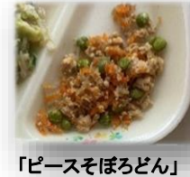
「ピースそぼろどん」