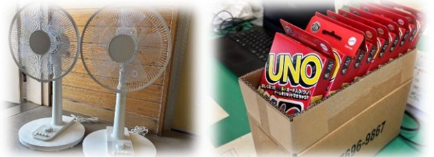
購入した扇風機とUNOです。何とか3万円以内に納まりました。

子どもたちへのアンケート結果です。一度アンケートを取った後、条件を満たした5つの中から投票によって選びました。