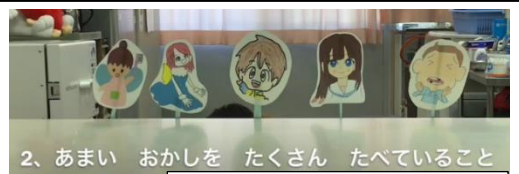
発表のワンシーン

また、「歯のクイズ大会」も企画され、低・中・高学年別に各5問出題されています。昼休みなどにクイズに挑戦する子どもたちの姿が見られています。保健委員会の皆さん発表ありがとうございました！