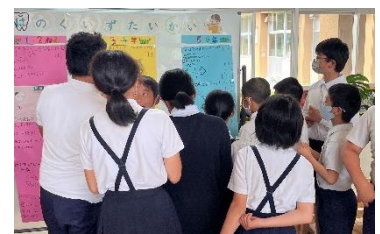
歯のクイズは解けるかな？