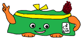
本校のキャラクター「よこ山くん」