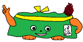
本校のキャラクター「よこ山くん」