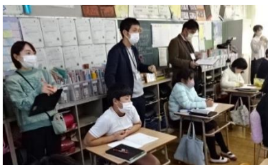
研究授業の一コマです！