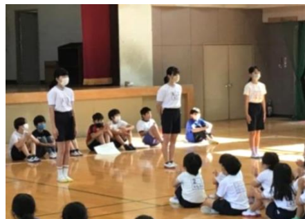
応援団長の決意表明