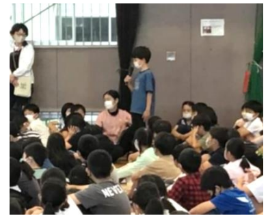
様々な学年から感想のお返し