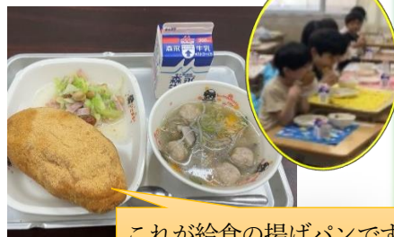
これが給食の揚げパンです

別の日には、不動の一番人気「揚げパン」が今年度初めて出ました。初体験の1年生も「甘くておいしい」と笑顔でかじりついていました。