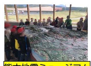
熊本地震ミュージアム

熊本市は全国20の政令指定都市の中で、子どもの虫歯は最下位を争うほど多い状況です。この状況を改善すべく、市の健康づくり推進課及び区の保健子ども課が中心となって進めている事業です。